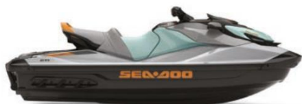
GTITM SE 170