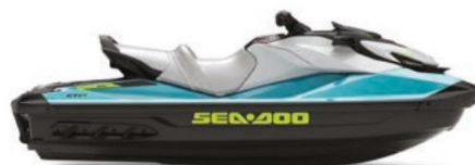
GTITM SE 170